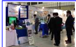
はままつメッセ EMS-JPブースに出展しました