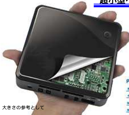
大きさの参考として